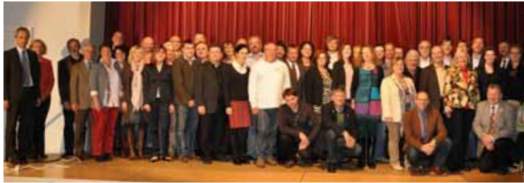
Gründungsmitglieder der LAG Altmühlfranken e. V.